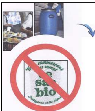
sacs biodégradables & litières pour chat