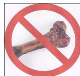
os et carcasses