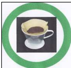
marc de café (sans filtre)