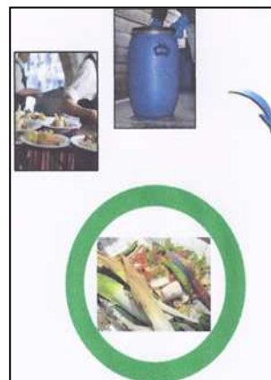
épluchures, coquilles d'œufs