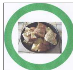
pains et confiserie